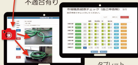
タブレット(改善措置記録)

清掃等が正しく行われたことを目視確認します。タブレットでログインし、記録票に確認の登録をします。