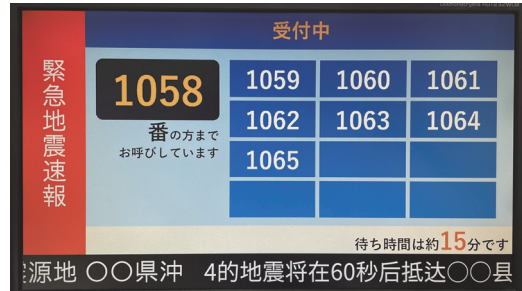
表示画面例（中国語簡体字） Display screen (Simplified Chinese)