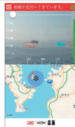
表示画面 Service screen