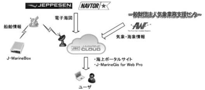
J-Marine Cloudの構成 Structure of the J-Marine Cloud

これまでお客様が個別で手配していた「電子海図表示装置 (ECDIS) の購入・装備」「電子海図表示装置のトレーニング」「チャート (海図) 利用契約」「電子海図料金清算」などを一手にお引き受けするサービスで、電子海図表示装置導入から電子海図購入に関わる煩雑な業務を代行する。なお、電子海図は2つの電子海図販売ベンダー (NAVTOR, JEPPESEN) から選択できる。(AVCS/