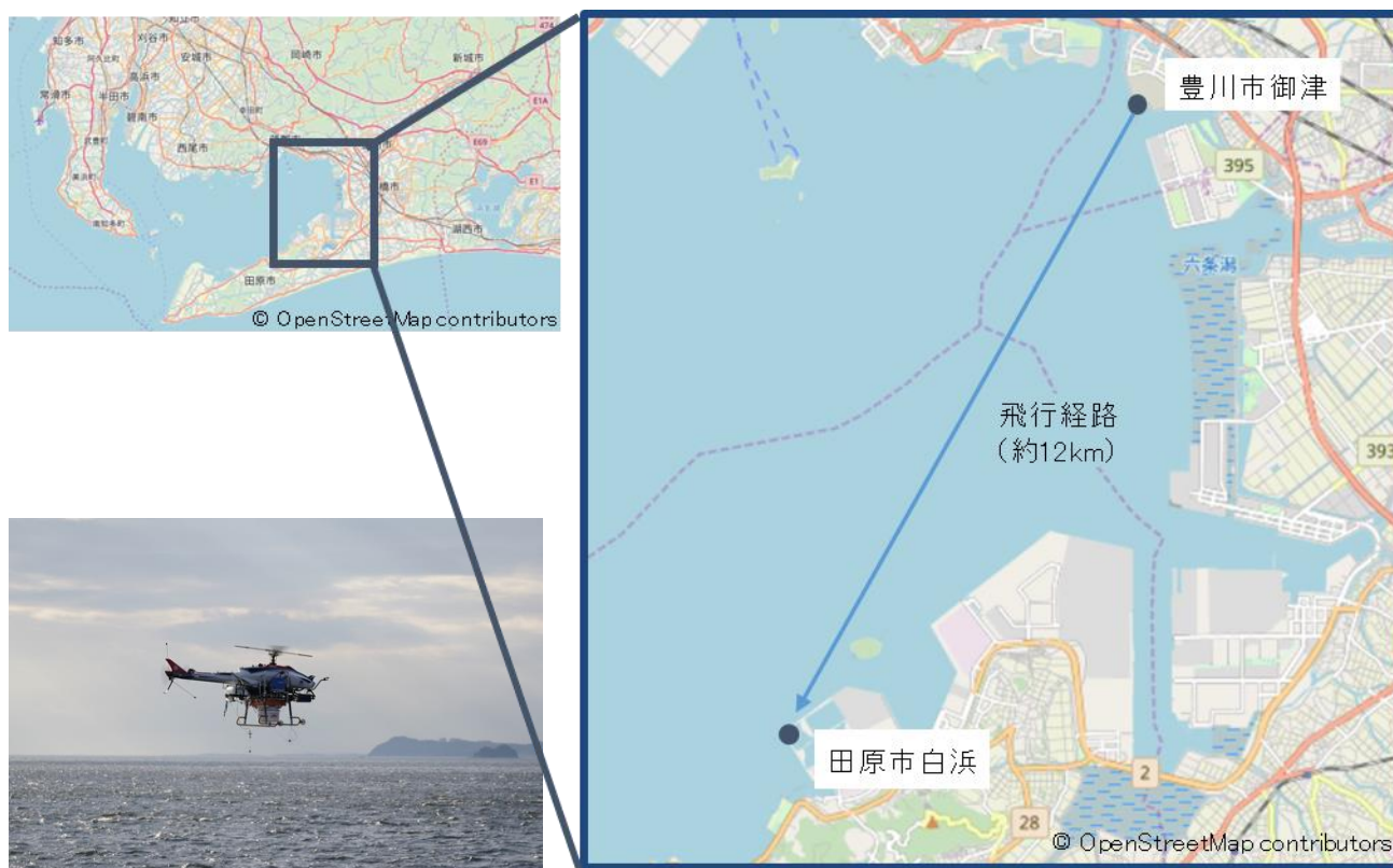
図1 飛行実証試験のイメージ

本技術により、離島間物流のように、地上と無人航空機間の通信インフラが十分に整備されておらず、緊急時の回避経路の指示などの地上からの支援が受けられない状況下でも、無人航空機を安全に運用することが可能になります。